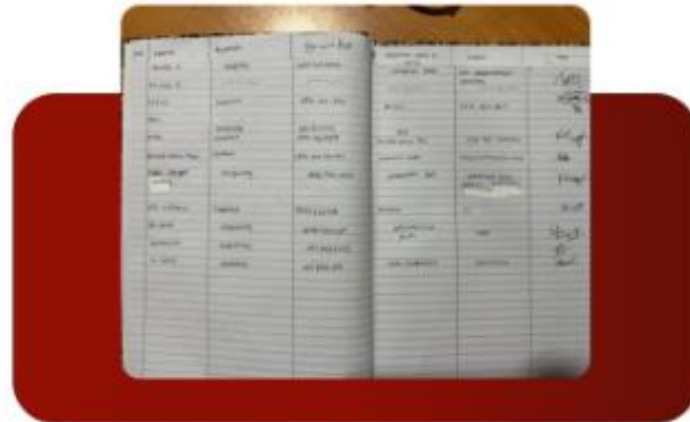
Isi buku registrasi